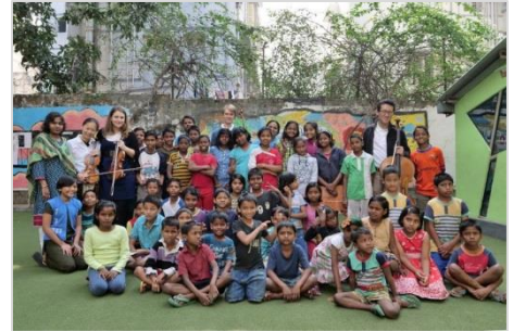
19. Future Hopeの子どもたち

インドで私達はたった2日間しか残っていません。時間という話題はとても興味深いもので、また、私達が意識するものでもあります。時間は時にリラックスしたもののようで、又早く過ぎているように感じます。ICEP ツアーメンバーの誰一人として、インドで後2日しかないこと、そして既にここに10日も居たと言うのが信じられません。インドの古典音楽の音色は未だ私達の耳に残るなか、「フューチャー・ホープ」に向かいました。例の「あちら」→と指差す方向案内にそって学校に着き、食堂でウォームアップをするその間、キッチン・ヘルパーが、野菜を洗ったり、切ったり、分けたりしていました。子どもたちは彼らが学校がお休み中なのに集会の為に集められたのですから、プレゼンテーションの始頃は、不満そうに見えたのですが、それは私達の想像だったのかしら。でもコンサートの中頃には、彼らがとりつかれたようになったのがわかったのです。子どもたちの英語力は高かったので、通訳なしで、ゆっくり、はっきりと喋りかけ、彼らも恥ずかしがらず、私達に質問をしました。