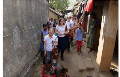
16. コンサートのために居住者を集めるカルテットメンバー