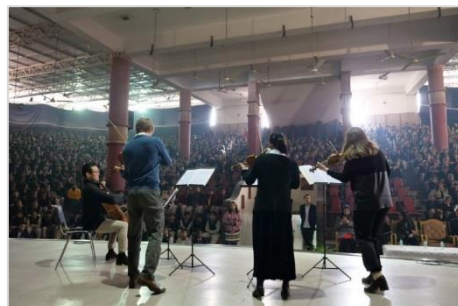
4. 全校生徒の前で演奏するカルテット