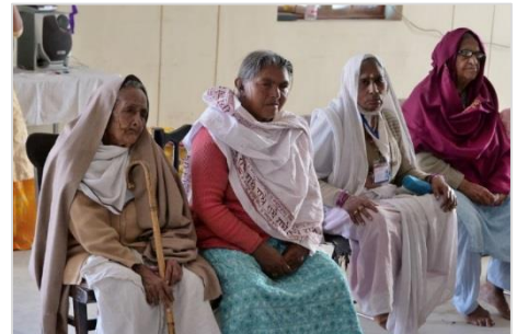
14. 西洋クラシック音楽に聴き入る女性たち