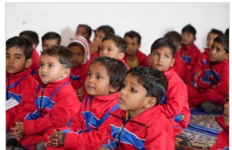
20. はじめてのカルテット演奏を注意深く聴く子どもたち

デリーに戻ってきた私たちは、全員風邪を引いています。音楽を咳、鼻をかむ音が伴奏のアンサンブル。いつも全員同じバンに乗って移動し、いつも一緒にいるのですから、全員一斉に病気にもなるのは、連帯感の賜物ですね。今日でICEPインドの活動も最終日となりました。少なくとも暫くの間はインドとも、仲間ともお別れです。