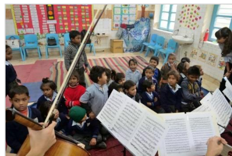
7. 音楽クラスで演奏