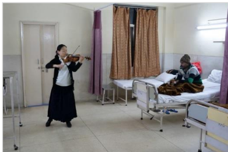
5. 病室で演奏する五嶋みどり

色、匂い、味…すべてをのみ込むようなスモッグの中、今朝は、スラム街の子どもたちも音楽を学べる、ミュージック・バスティ (Music Basti) のプログラム が行われている学校へタクシーで向かいました。その途中、インド門 (India Gate) の近くを通ったのですが、100m程の距離にもかかわらず、辛うじて認識できる程度で、まるで立ち込める重い灰色の雲の中に白い大理石の門が浮かんでいるようでした。ハイウェイで街を通り過ぎる合間に現地の人々の生活を垣間見ることができました。最新のしゃれたバス乗り場の隣で果物や野菜を売る人たち、舗装されていない歩道で野宿するホームレス、子どもたちや、スーツを着た男性など… そんな中、車が突然停車しました。私たちの前方の車2台が衝突したのです。運転手たちはそれぞれ車から出てきて、にこやかに、かつ礼儀正しく、大渋滞も気にかけることなく、しばし話し合い、その後何事もなかったかのようにそれぞれの車に戻っていき、ようやく私たちの車も動き出しました。今日は多くの子どものたちや患者さんたちに会う予定です。