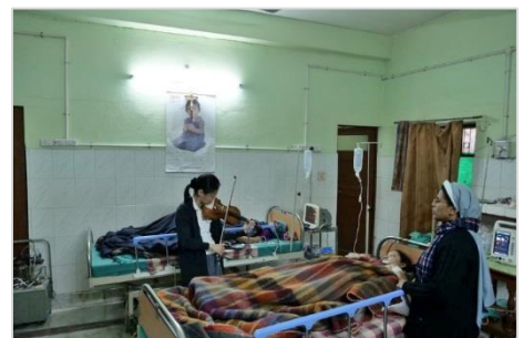
12. 患者を前に演奏する五嶋みどり