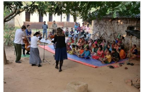
17. Peardoba Leprosy Colonyの居住者の前で演奏

西ベンガル州に来て2日目を迎えました。昨日はデリーからコルカタへのフライトが遅れましたが、誰もイライラしていないのに感心しました。いつ何をするかを決めるのは時間か人か、まあ考え次第でしょうか。