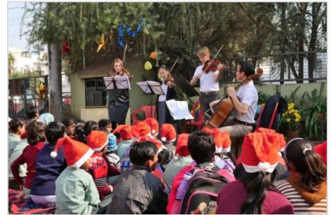
13. クリスマスの飾りつけがされた事務所の庭で演奏