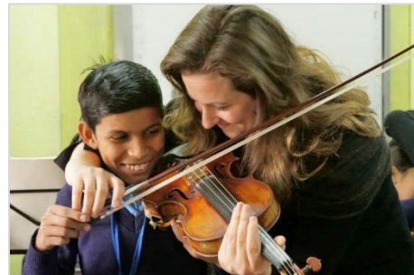
6. エリーナの楽器体験の様子