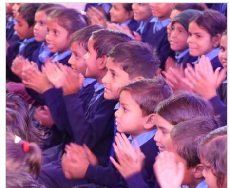
11. カルテットの演奏に聴き入る子どもたち