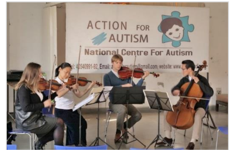
1. Action for Autismにて