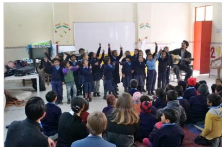
3. 音楽クラスの生徒たちがカルテットに歌を披露