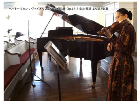
エンディングロール